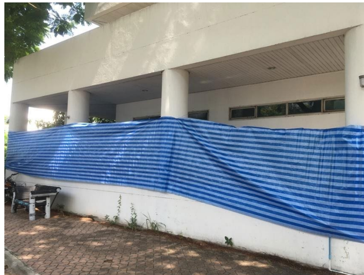
ภาพ การป้องกันฝุ่นละอองในการปรับปรุงห้องในคณะ