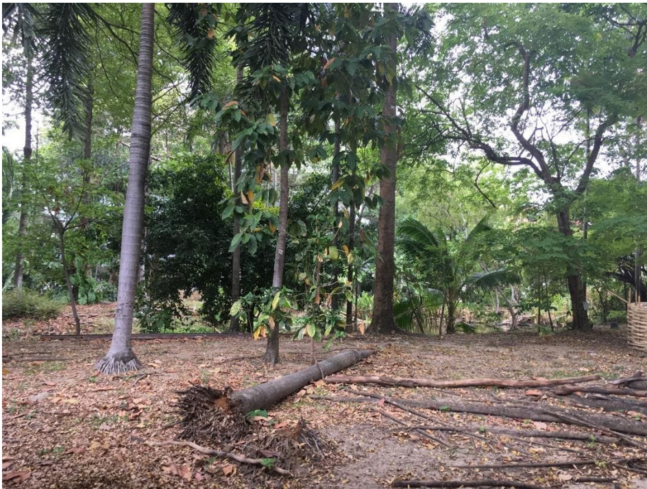
ภาพพื้นที่ที่จะปรับเปลี่ยนเป็นพื้นที่สูบบุหรี่ภายนอกอาคาร

เขตสูบบุหรี่ที่จัดให้ต้องมีระบบระบายอากาศ มีการถ่ายเทอากาศหมุนเวียนระหว่างภายนอกอาคารและภายในเขตสูบบุหรี่